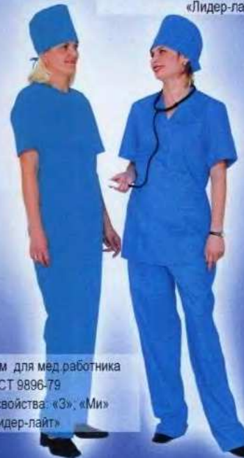
ШВМ2 Костюм для мед. работника ГОСТ 9896-79 Защитные свойства: «З»; «Ми» «Лидер-лайт»