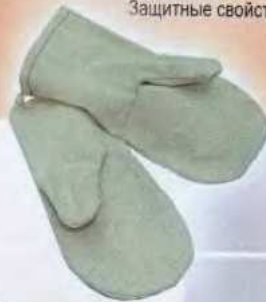
М19 Рукавицы х/б с наладонником из ПВХ ГОСТ 12.4.010-75, тип В материал: ткань «двунитка» Защитные свойства: «Ми»