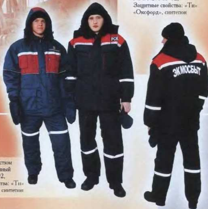
M121 M122 Костюм мужской утепленный ГОСТ 293 35-92, Защитные свойства: «Тн» «Старт-Лидер», синтепон