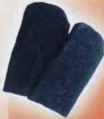
М36 Рукавицы суконные ГОСТ 12.4.010-75, тип В материал: сукно ОП Защитные свойства: «Тр»