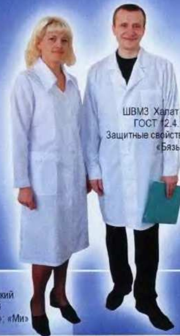
ШВМ3 Халат мужской ГОСТ 12.4.132-83 Защитные свойства: «З»; «Ми» «Бязь»