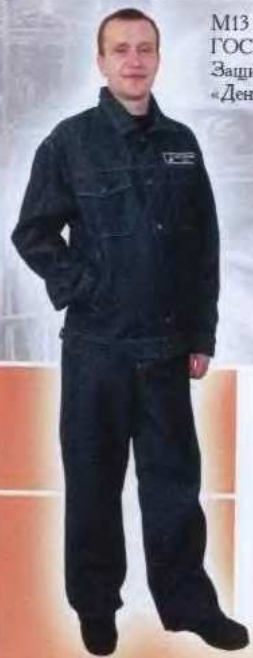
М13 М16 Костюм мужской ИТР ГОСТ 27575-87 Защитные свойства: «З»; «Ми» «Деним»