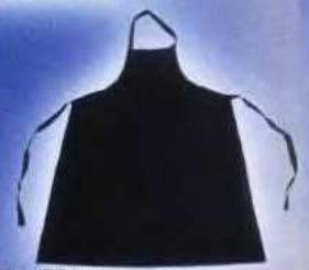
M11 с. Фартук ГОСТ 12.4.029-76 Защитные свойства: «Тр» Сукно ОП