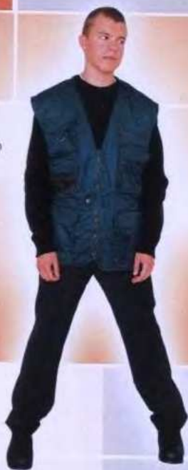
M 86 A Жилет разгрузочный Защитные свойства: «З», «Тн» «Грета»