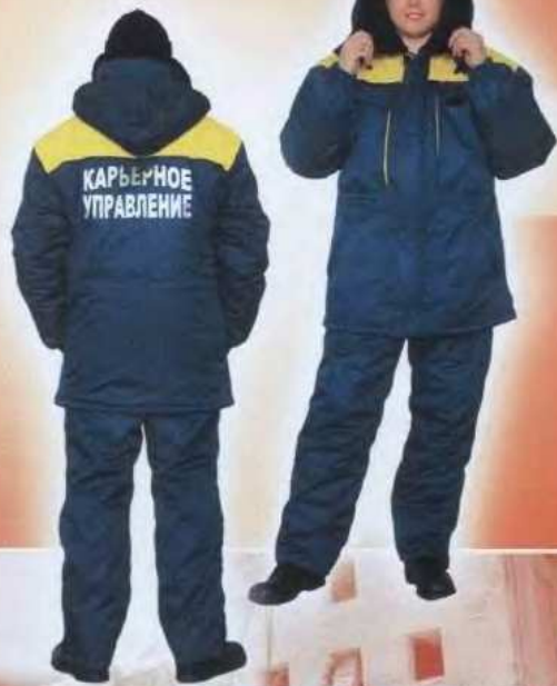
M64 M65 M66 Костюм мужской утепленный ГОСТ 293 35-92, Защитные свойства: «Тн» «Грета», синтепон