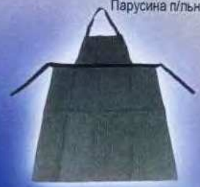
M11 бр. Фартук ГОСТ 12.4.029-76 Защитные свойства: «Тр» Парусина п/льняная ОП