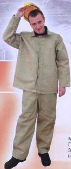
M17 M18 Костюм мужской ГОСТ 27653-88 Защитные свойства: «Ву» парусина п/льняная ВП