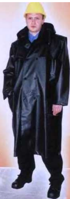
M41 Плащ мужской ГОСТ 12.4.134-83 Защитные свойства: «Ву» ткань прорезиновая, основа - хлопок 100%