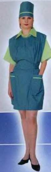
ШВМ3 А Халат женский ГОСТ 12.4.131-83 Защитные свойства: «З»; «Ми»