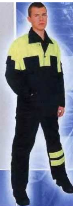
М 112 М113 Костюм мужской ГОСТ 27575-87 Защитные свойства: «З»; «Ми» «Лидер-210»