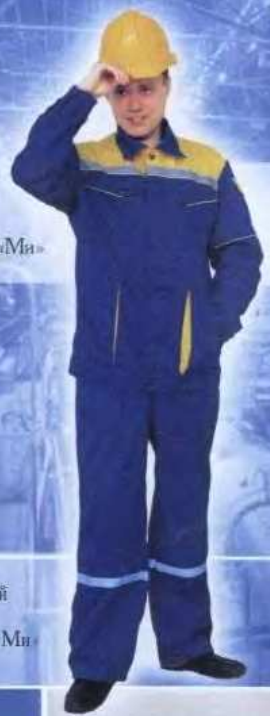
М 69 Комбинезон мужской ГОСТ 12.4.100-80 Защитные свойства: «З»; «Ми» «Ортон»