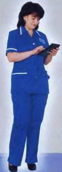
ШВМ 101 Костюм женский Защитные свойства: «З»; «Ми» «Лидер 180»