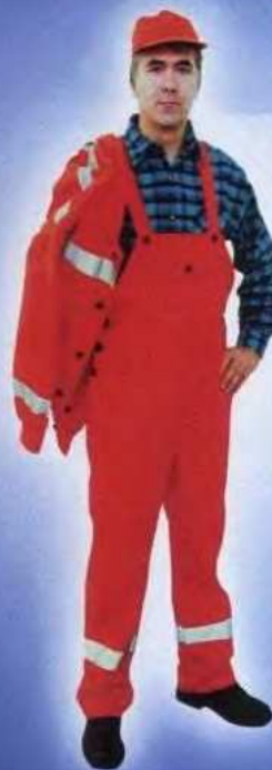
М1 М16 Костюм для дорожных работ Защитные свойства: «Со» "Ортон"