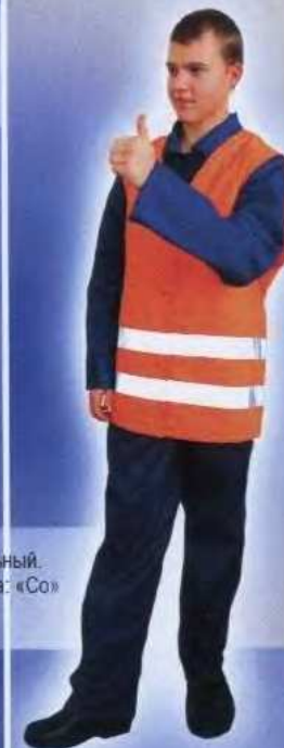
М99 Жилет сигнальный. Защитные свойства: «Со» "Габарит"