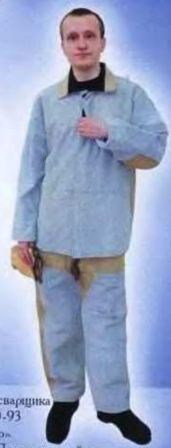
M78 M79 Костюм для сварщика ТУ 8572-017-00302190-93 Защитные свойства: «Тр» Парусина п/льняная ОП, кожаный стплук