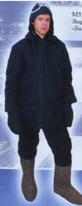
M22 Куртка утепленная ГОСТ 293 35-92, тип Б Защитные свойства: «Тн» «Балтика», ватин х/б