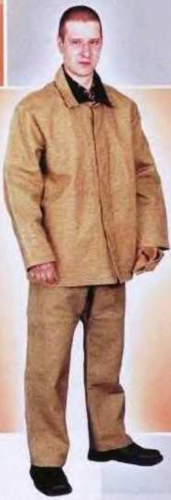
M67 M68 Костюм для сварщика ТУ 8572-017-00302190-93 Защитные свойства: «Тр» Парусина п/льняная ОП