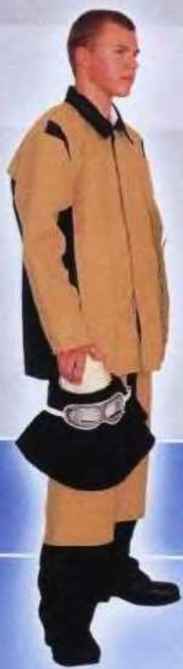
M530 M54 Костюм металлурга ГОСТ 12.4.045-87, тип А Защитные свойства: «Тр» Моделский ОП, накладной «Пировайтекс»