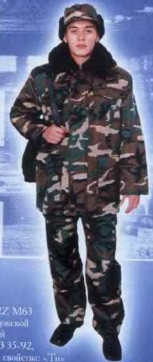
M62 M62Z M63 Костюм мужской утепленный ГОСТ 293 35-92, Защитные свойства: «Тн» «Грета», синтепон