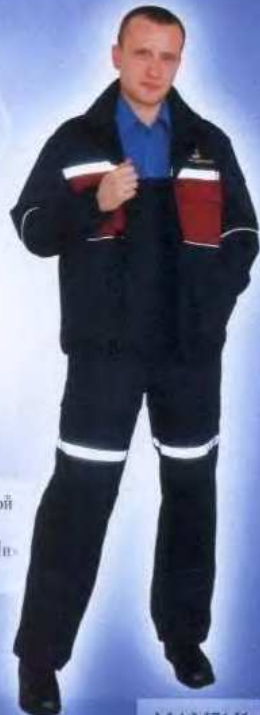
М1 М71 Костюм мужской ГОСТ 27575-87 Защитные свойства: «З»; «Ми» «Лидер 210»