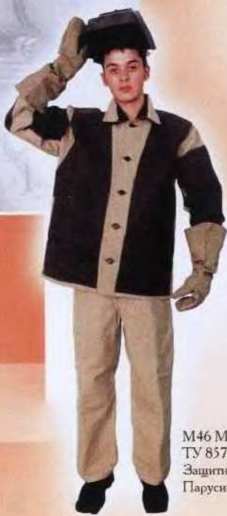
M46 M47 Костюм для сварщика ТУ 8572-017-00302190-93 Защитные свойства: «Тр» Парусина п/льняная ОП, сукно ОП