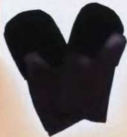
М25 Рукавицы утепленные ГОСТ 12.4.010-75, тип В Ткань верха – диагональ, утеплитель - х/б ватин 1 слой, подклад – бязь. Защитные свойства: «Тн»