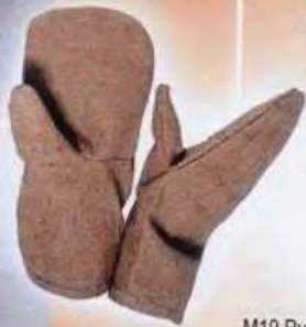
М19 Рукавицы брезентовые ГОСТ 12.4.010-75, тип В материал: брезент ОП Защитные свойства: «Тр»