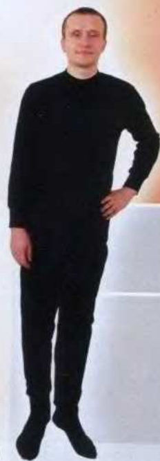
М140 М141 Комплект нательного белья ГОСТ 26085-84