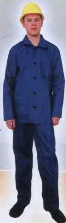
М3 М4 Костюм рабочий ГОСТ 27575-87 Защитные свойства: «З»; «Ми» «Балтика»