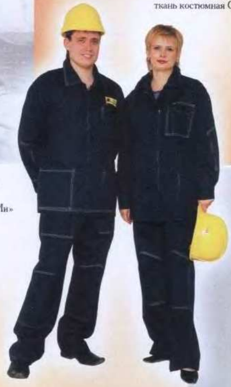
М74 М75 Костюм мужской ГОСТ 27575-87 Защитные свойства: «З»; «Ми» ткань костюмная С33-ЮД