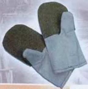
М19 Рукавицы х/б с брезентовым наладонником ГОСТ 12.4.010-75, тип В материал: диагональ, брезент ОП Защитные свойства: «Ми»