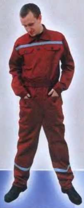
М 124 М113 Костюм мужской ОПЗ ГОСТ 27575-87 Защитные свойства: «З»; «Ми» «Грета»