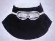
M106 Шлем-маска Защитные свойства: «Тр» Сукно ОП, очки