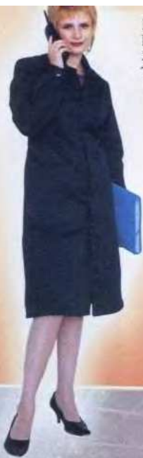
М 84 Халат женский ГОСТ 12.4.131-83 Защитные свойства: «З»; «Ми» Ткань костюмная С14-ЮД