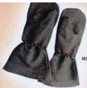
М44 Краги ГОСТ 12.4.010-75, тип Е материал: парусина п/льняная ОП Защитные свойства: «Тр»