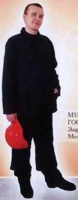
M53 M54 Костюм металлурга ГОСТ 12.4.045-87, тип А Защитные свойства: «Тр» Моделский ОП