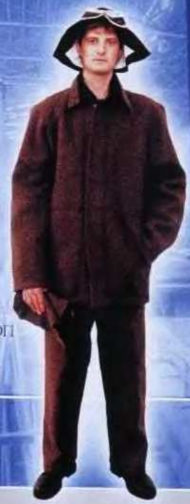
M39 M40 Костюм суконный ОП ГОСТ 12.4.045-87, тип В Защитные свойства: «Тн», «Тр» Сукно ОП